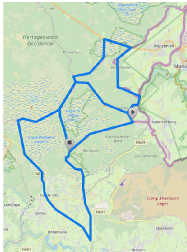
Les 3 parties de territoire attribués à Robertville : à l'est, la partie cédée par l'Allemagne (Ville de Montjoie); au centre, la partie cédée par Butgenbach ; à l'ouest, la section de Sourbrodt, également cédée par Butgenbach