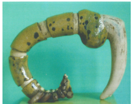
Sculpture en céramique « Le scorpion » de Vanhoebroeck Benoît