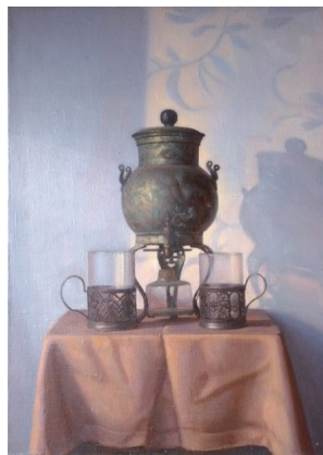
Peinture tout en lumière de Trushkova Irina