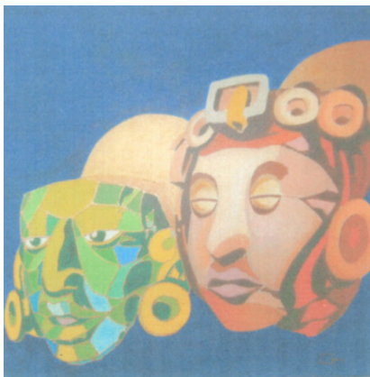
Peinture à l'acrylique de Gazon Jean-Marie

Les expositions sont à voir durant les heures d'ouverture de la maison communale : lundi et mercredi de 8h30 à 12h et de 13h30 à 17h30 ; mardi, jeudi et vendredi de 8h30 à 12h ; le 1er et le 3ème samedi du mois de 9h30 à 12h. Entrée libre.